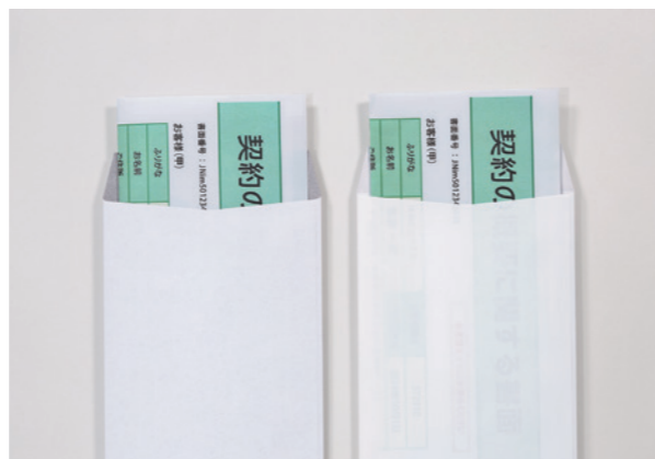
↑ 透けない封筒 ↑ 一般的な白封筒